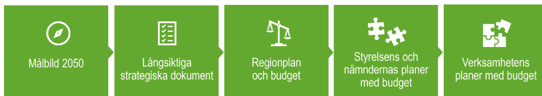
Figur 1. Styrkedja.

Regionplan och budget är det styrdokument som utgör grunden för verksamheternas årliga planering och budgetarbete. Regionplanen tydliggör planperiodens politiska viljeinriktning för respektive målområde. De politiska prioriteringarna och budget på övergripande nivå för respektive målområde ska ha en tydlig förankring i verksamhetens förutsättningar och förmåga. Regionfullmäktige kan i regionplanen för respektive målområde lägga till långsiktiga nyckeltal samt vid behov ge uppdrag för kommande år till styrelsen och nämnderna.